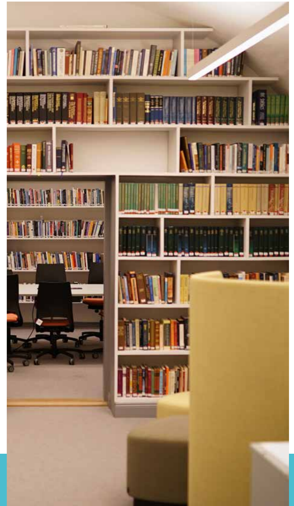
Folkhögskolan Kaggeholm flyttade från slottet på Ekerö till Rörstrand och blev granne med Filadelfiakyrkan.

10 — procent fler deltagare när YA-collegium blev digitalt