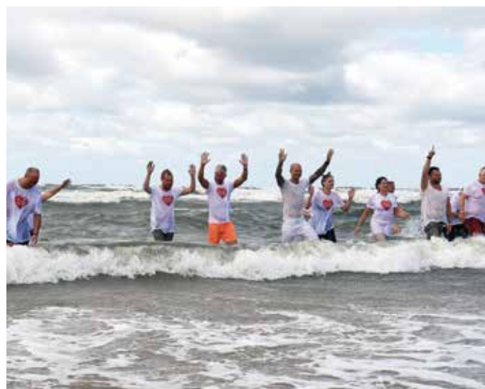
▲ Dop i havsvågorna vid Gullbranna i Halland.