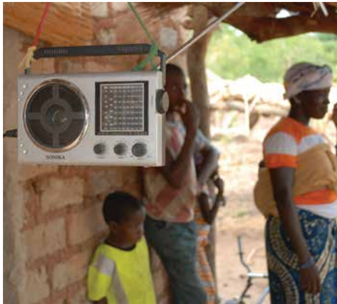
30 starka FM-sändare och en lokal församlingsrörelse gör det "stängda" Mali vidöppet för evangelium.

– Vi hamnade av en tillfällighet på pastor Pauls