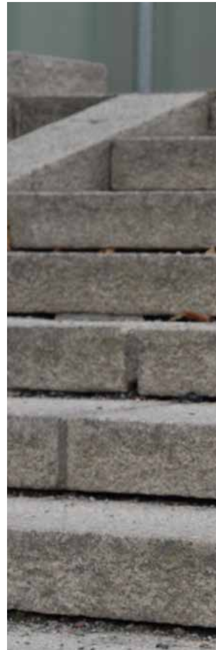
”Jag vill lyfta upp tuffa ämnen på bordet”.