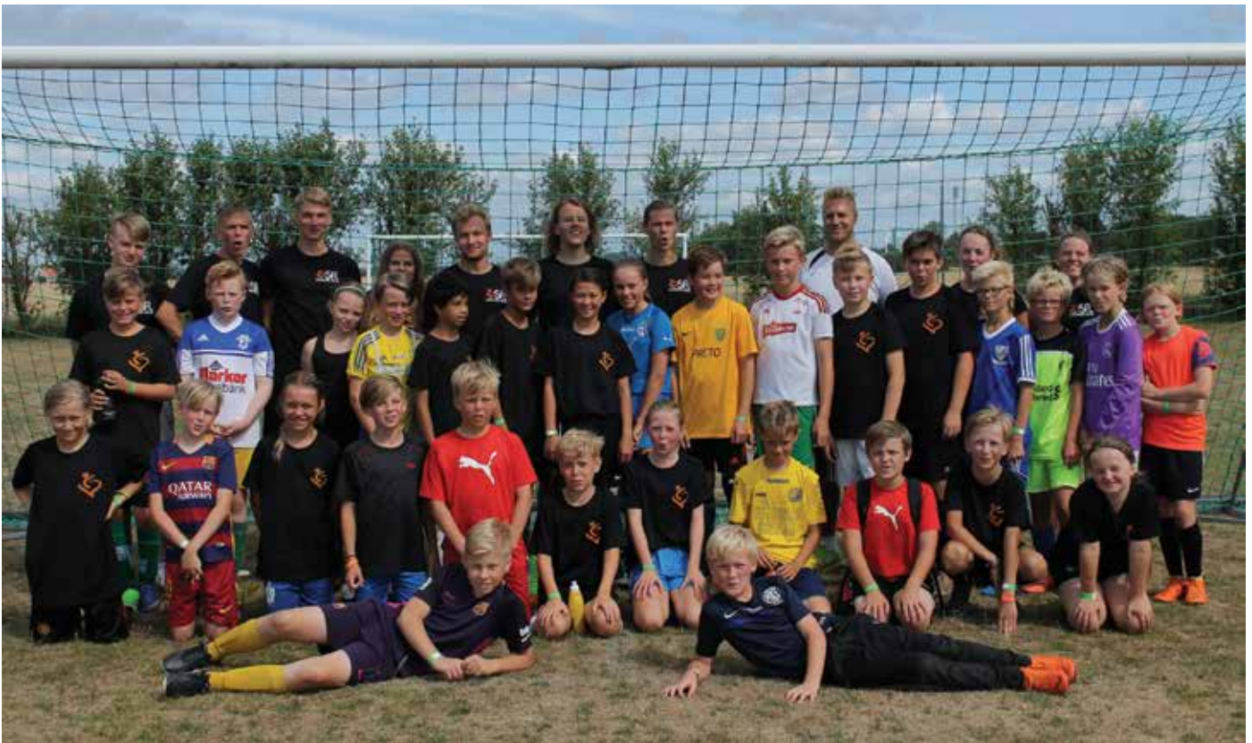
Sportveckan på Gullbrannagården samlade omkring 300 barn.