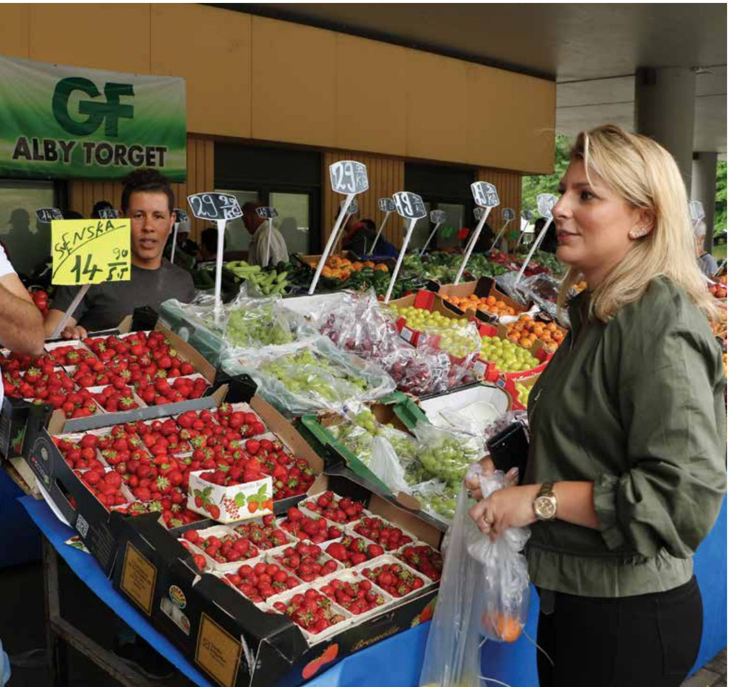
och naturligt och talar med försäljarna på deras eget språk. Nu är hon kallad att verka som evangelist i området, där hon själv är uppvuxen.

redan lagt grunden, som vi nu får bygga vidare på. Gud vet vad han gör, konstaterar hon.