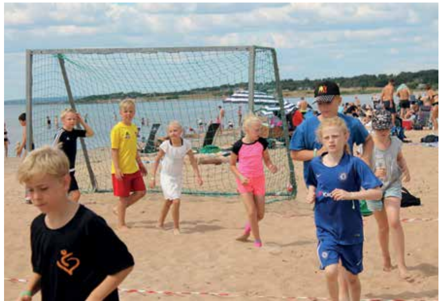
Sportveckan på Löttorp lockade cirka 250 barn.