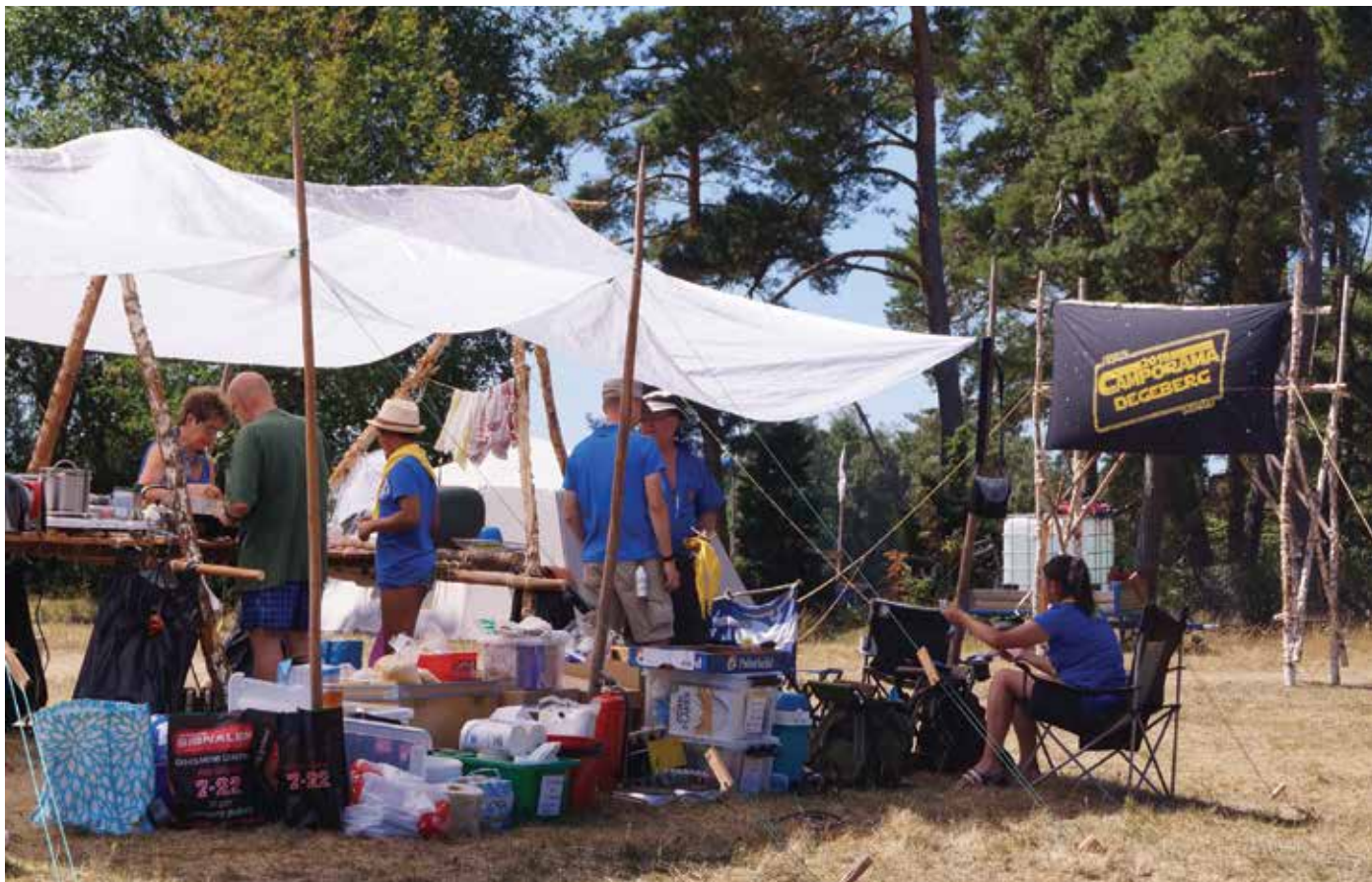
Omkring 140 deltagare och ledare fanns med på Royal Rangers stora läger Camporama 2018. Temat för året var Star wars rymdberättelser.