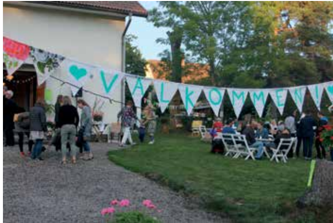
Satsningen En tro på landet inleddes med en trädgårdsfest, som bjöd på grillning, kyrkfika, lek, förbönstält och fotoutställning. Drygt 70 personer i olika åldrar deltog i invigningsfesten. Vardagsgemenskap är en viktig grundbult i den nya församlingens arbete.

Intresset för församlingsplantering föddes tidigt och hon var