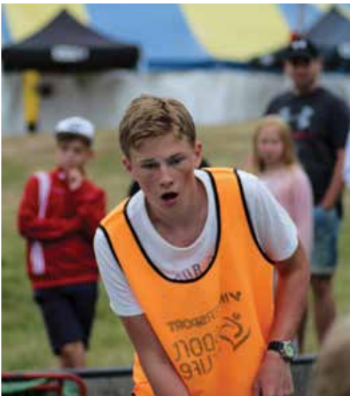
Sport for Life stod för sportaktiviteterna under Nyhemsveckan.