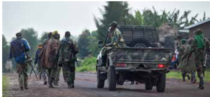
Rebeller i Kongo.

Församlingen i Lemera, som består av 5016 medlemmar och lika många barn, driver förutom förskola, grundskola och sjukskoterskolor ett sjukhus som når nära 170 000 människor i området. Man har ett nära samarbete med Dr Denis Mukwege och Panzisjukhuset som ligger nio mil bort i provinshuvudstaden Bukavu, och precis som på Panzi arbetar man vid sjukhuset