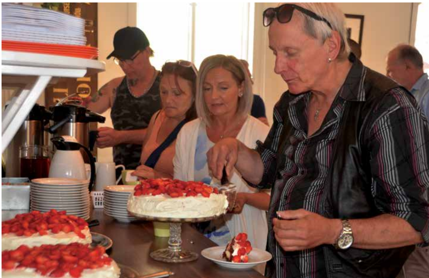
Stödboendet har vuxit fram under de två senaste åren, men i pingsthelgen var det invigning på riktigt med tårtfest.