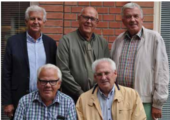
Ledningsgruppen för seniornätverket samlade till planeringsmöte på Pingsts kontor i Alvik.