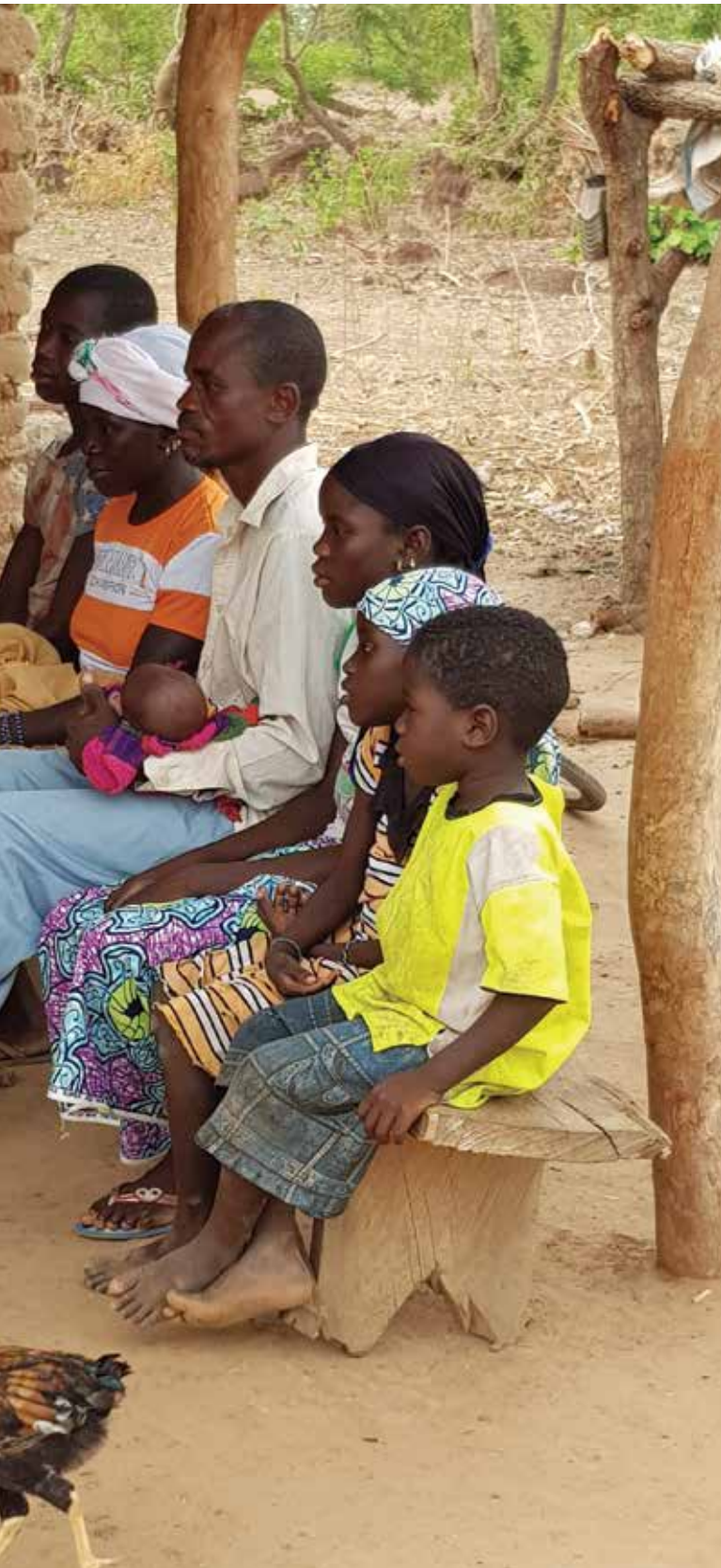
frid och ro efter att ha tagit till sig budskapet i de kristna radiosändningarna och enkel hydda mitt ute på en åker.