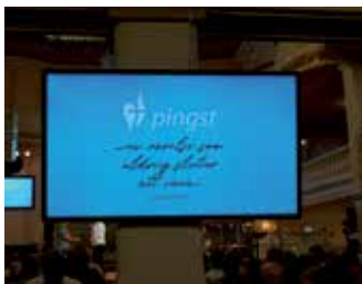
Orden "En rörelse som aldrig slutar att växa" från framtidsbilden var ett genomgående tema under Rådslagsdagarna.