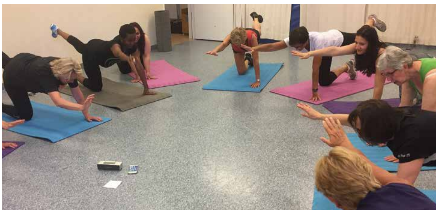
Varje måndagskväll (utom under jul- och sommarloven) i närmare 30 år har en grupp kvinnor mötts till träningspass i Vallhovskyrkan i Sandviken.