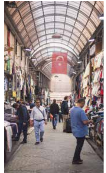
I Turkiet möts öst och väst på ett påtagligt sätt.

– När jag antog utmaningen att resa hit och jobba sade jag till Gud att nu lägger jag ner min musikkariär för att tjäna dig. Det jag inte visste då var att jag skulle få använda musiken till att nå ut med det jag håller högst – nämligen Jesus, berättar hon.