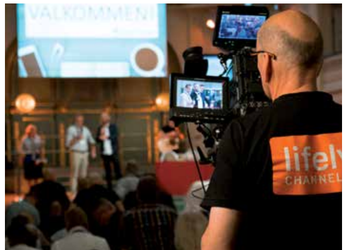
Lifely.se direktsände fredagskvällens gudstjänst, och fanns också med för att presentera programkonceptet Min Söndag.