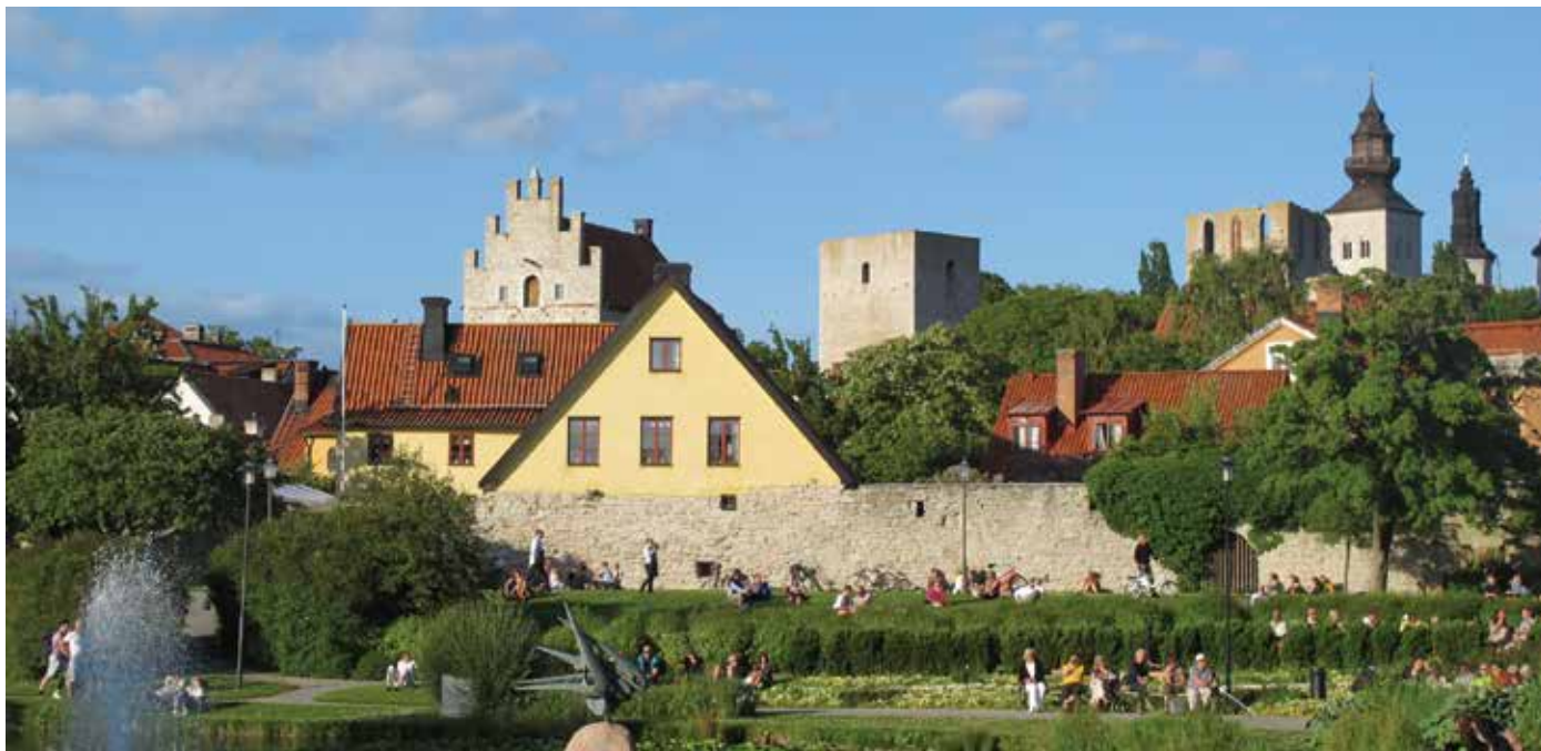
Pingst – fria församlingar i samverkan kommer även i år vara en del av konceptet "G som i Gud" under Almedalsveckan. Men Pingst satsar också på egna utåtriktade aktiviteter hela måndagen utifrån ett tält på hamnplanen i Visby.