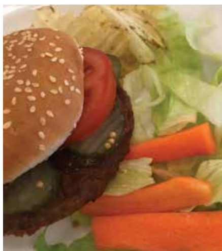
Det ska vara goa grejer som serveras på after work. Hamburgare brukar alltid gå hem, precis som tacos och köttbullar.

FÖR PINGSTKYRKAN NÄSSJÖ blev after work en viktig pusselbit. Upplägget är lika enkelt som genialt.