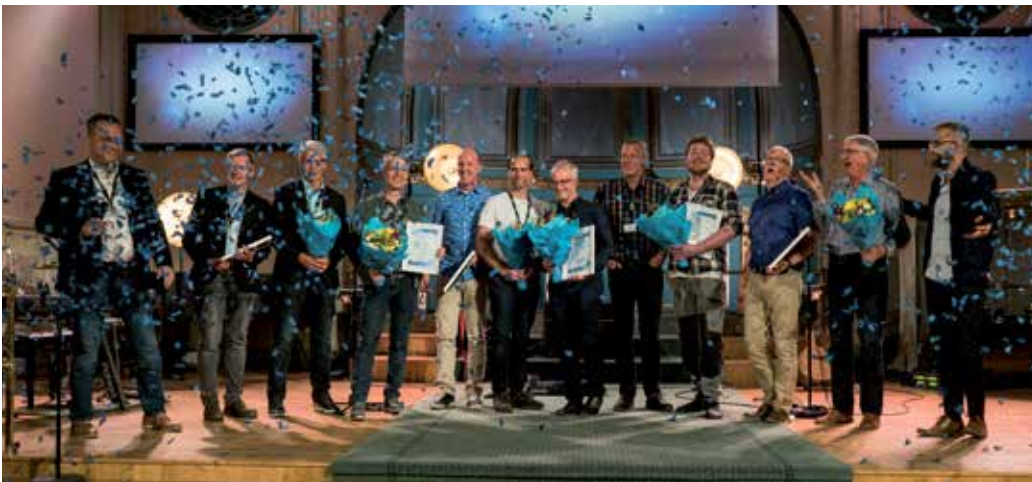
Confettiregn, diplom och buketter gjorde välkommandet av nya församlingar in i Pingst extra festligt.