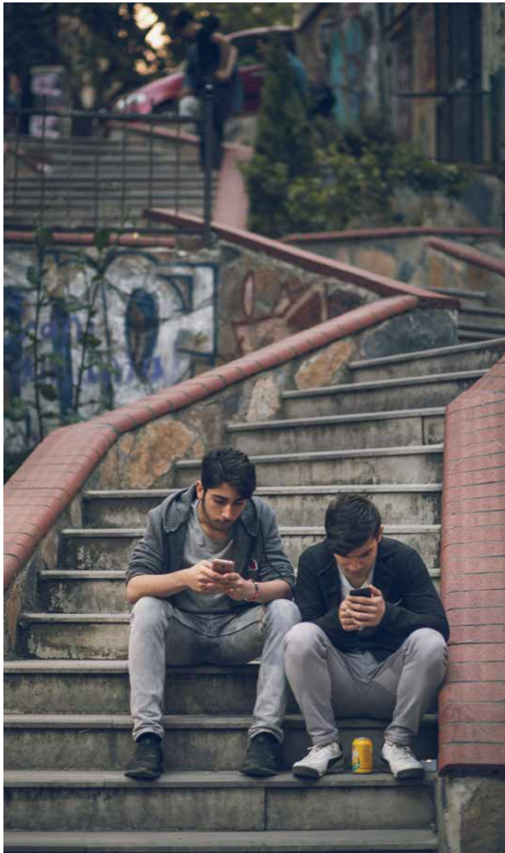
Den nya Youtube-kanalen Umut Kalesi når turkisktalande med evangelium.

Fotnot: Här finns kanalen: youtube.com/umutkalesi