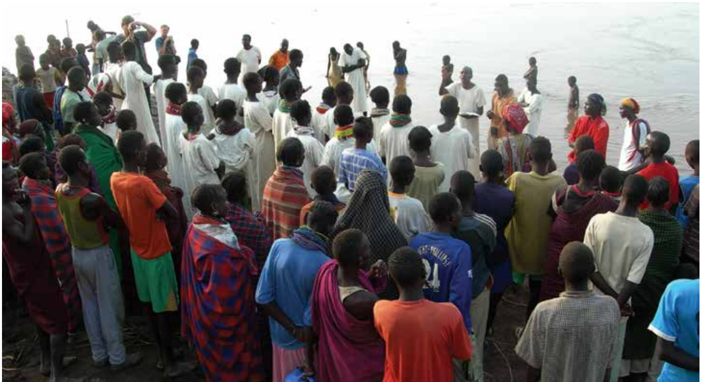
Nyangatomförsamlingar finns både i Etiopien och i Sydsudan. Här är det dopförrättning.