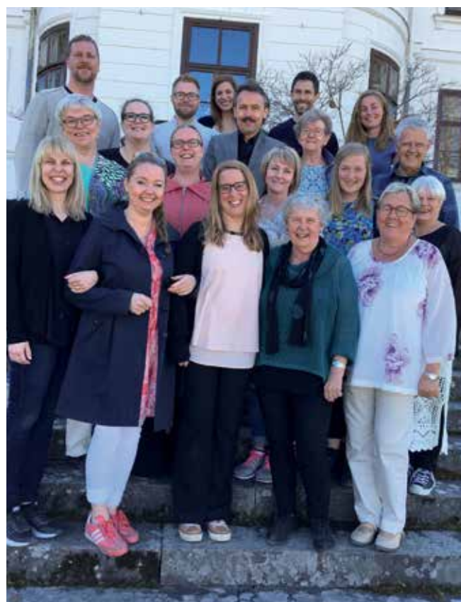
Årets deltagare och lärare fotograferade vid den sista av fyra träffar.