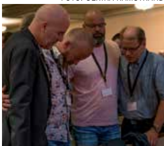
Bön för Sverige och framtiden i små grupper.