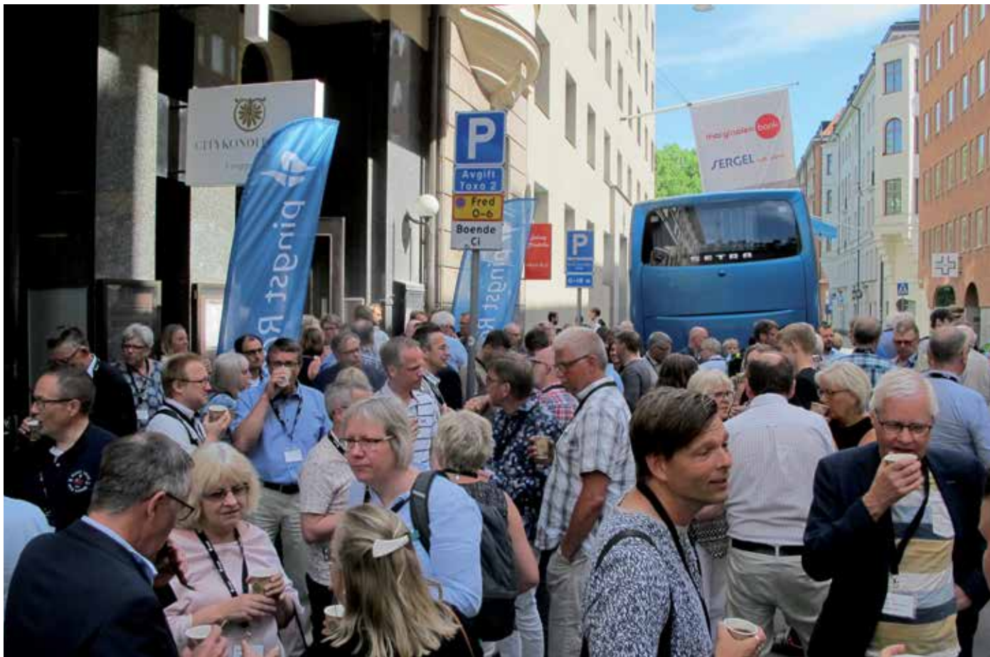
Många valde att ta med sig kaffet utomhus i det fina försommarvädrat och det blev lite gatufestkänsla utanför kyrkentrén.