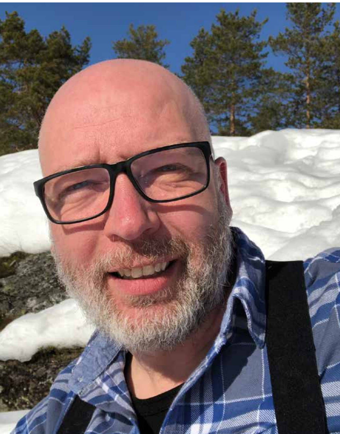
ny ordförande för styrgrupp Pingst Socialt och LP-verksamhetens styrelse.