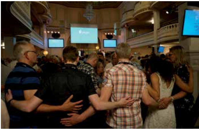
Förhandlingar och bön går hand i hand under Pingsts Rådslag.