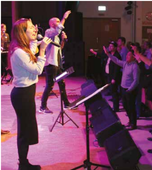
Ledardagarna anordnas för att utrusta och stärka de många ideella ledarna i pingstförsamlingarna runt om i Sverige. Bilden från förra årets regionala ledardag i Umeå.