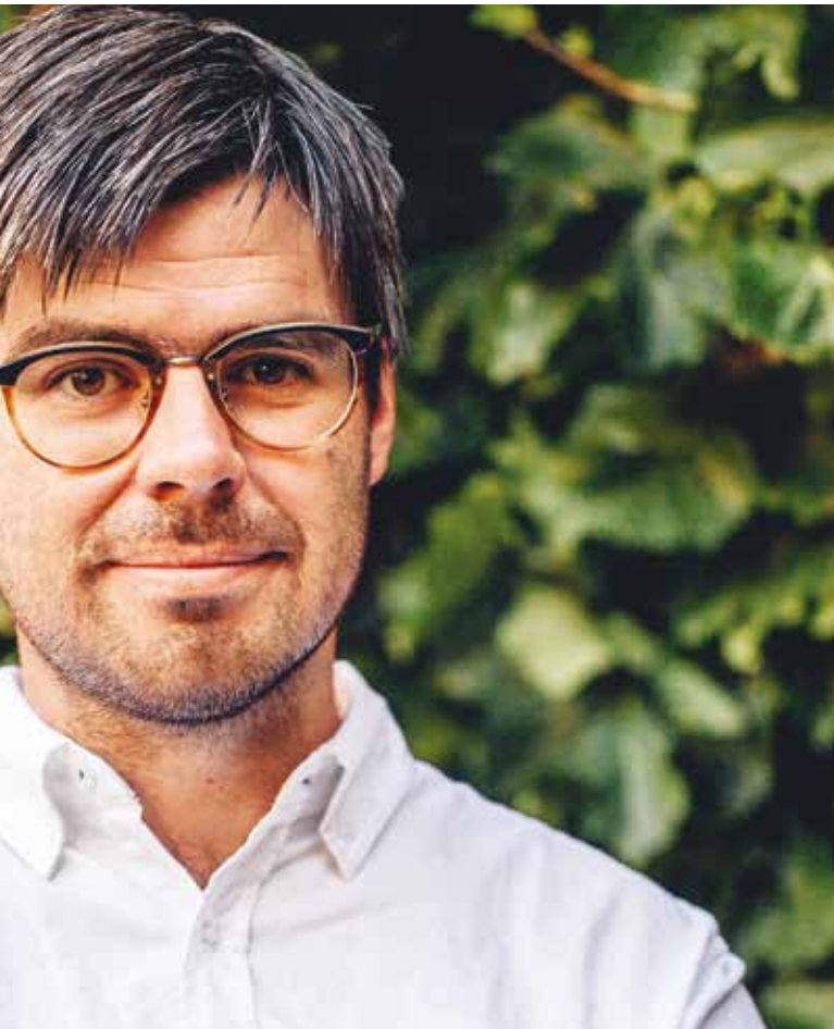
Pethrus, där han bland annat skriver om hans ledaregenskaper.