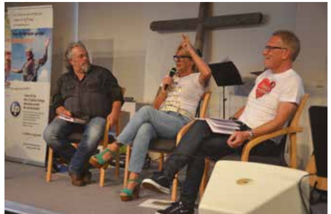
Panelssamtal om framtiden för LP-verksamheten under konferensen i Arjeplog.