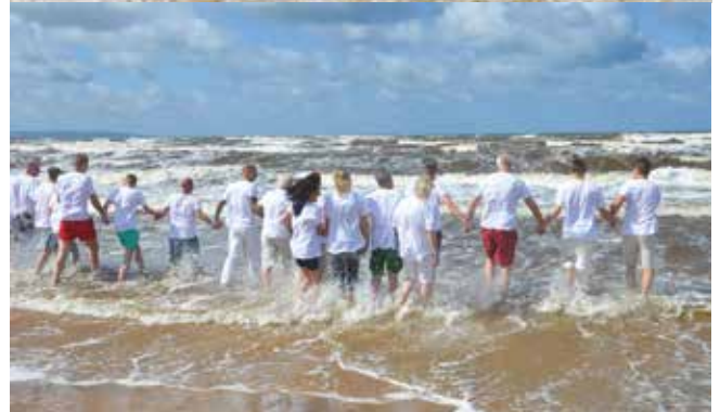
Vid dopförrättningen i Gullbranna döptes 18 personer. Vädret var dramatiskt och vågorna höga.