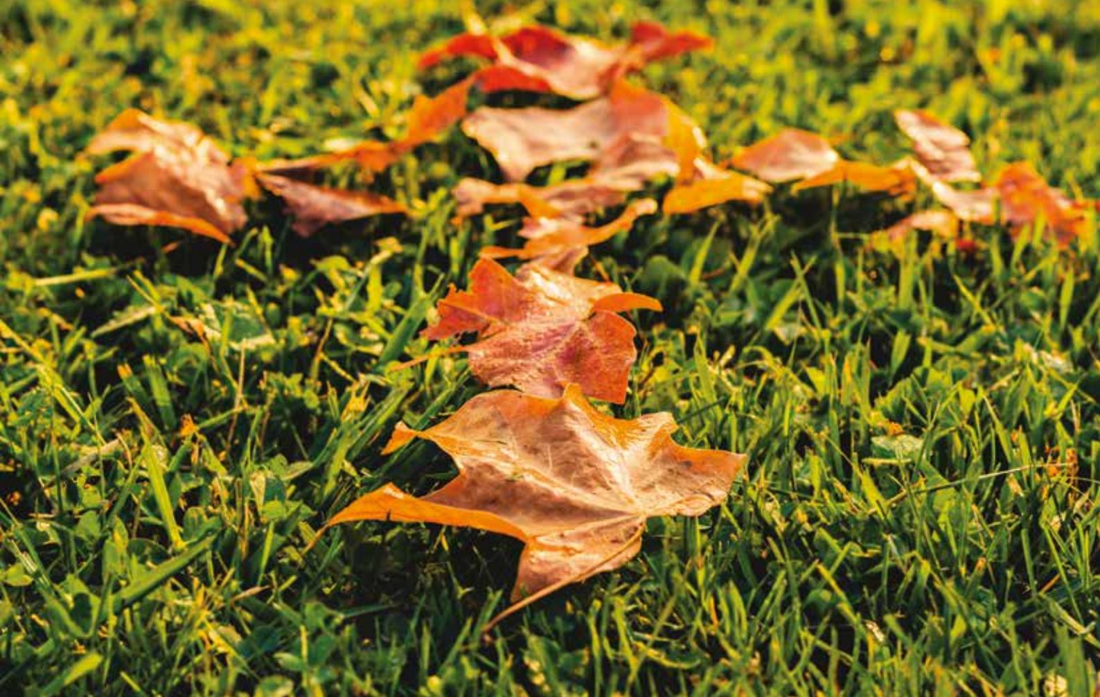
Kliv in i höstens vila.