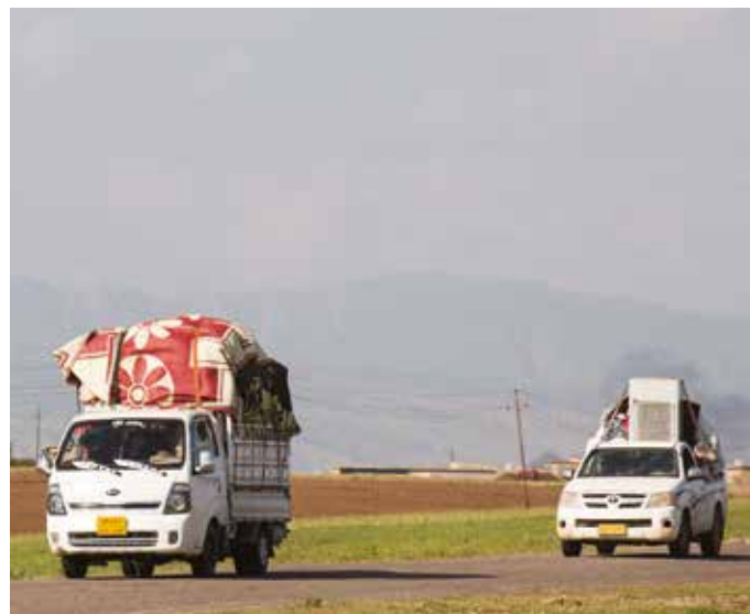
Många återvänder till sina befriade byar, trots förödelsen som råder där. "Hemma är alltid hemma", är svaret på hur de orkar.

De största behoven just nu är att få tillgång till vatten och el, bygga upp hus och vägar samt få