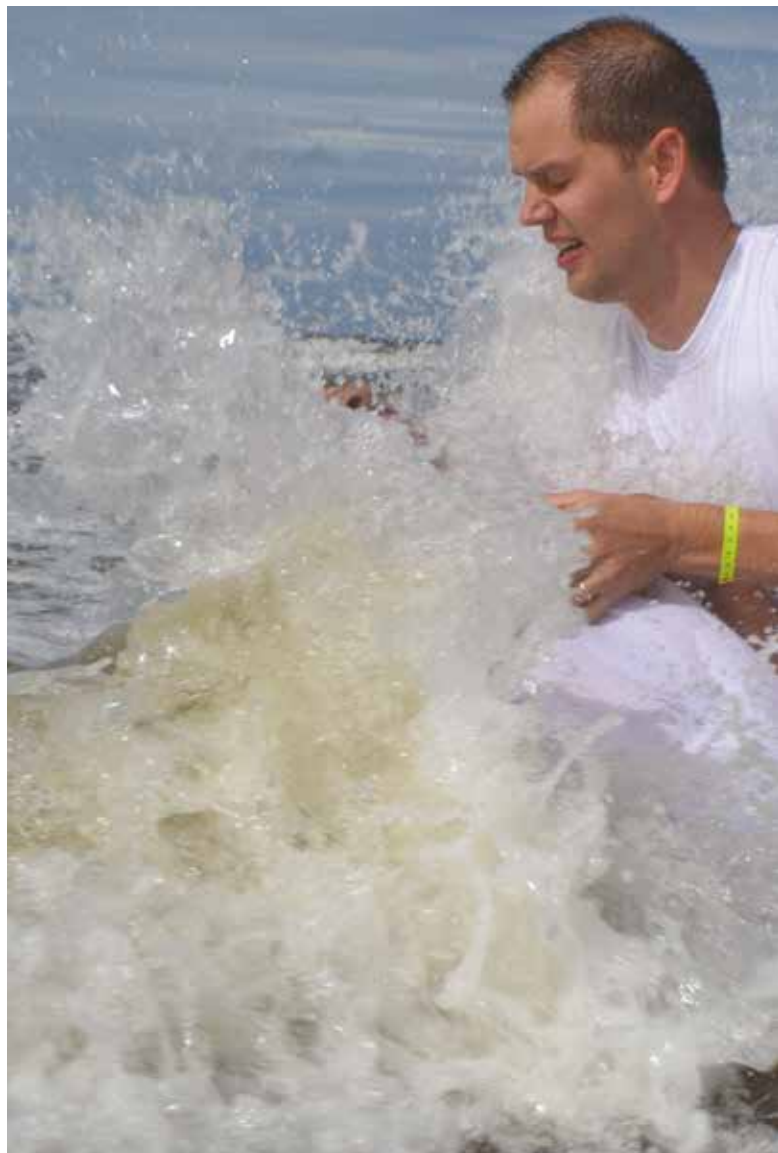
2 359 personer döptes i pingstförsamlingarna under 2016. Antalet döpta ökar för