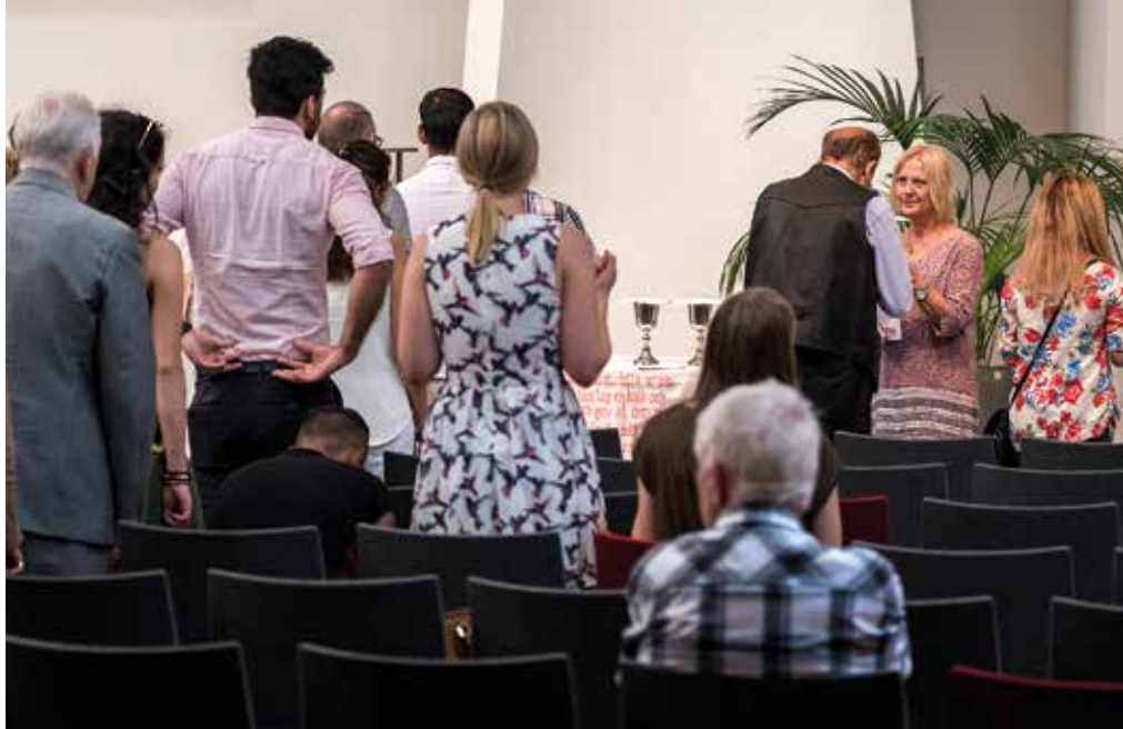
Kön ringlar lång till nattvarden.