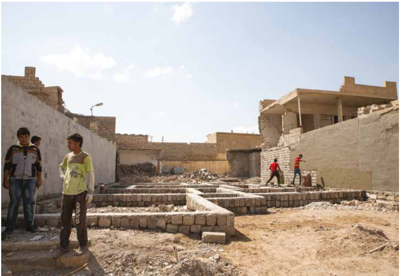
Återuppbyggnadsarbete i irakiska Khorsabad.