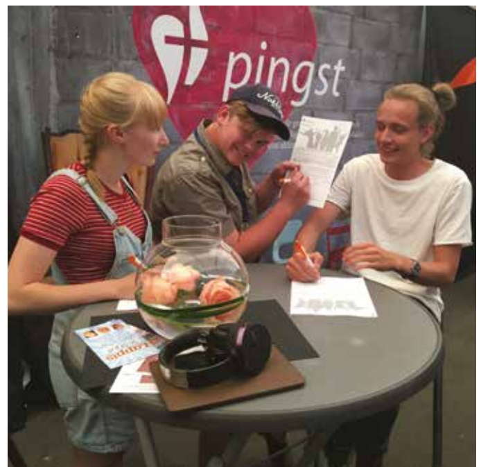
Under Nyhem och Lappis tog många chansen att anmäla sig som kyrkoavgiftsgivare till Pingst.