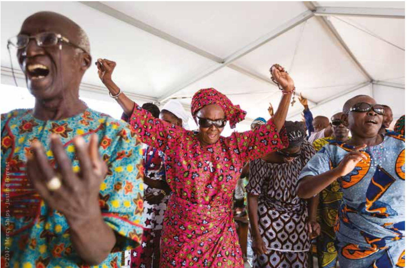
Att ha fått synen tillbaka genom en starroperation är här anledningen till fest med sång och dans.