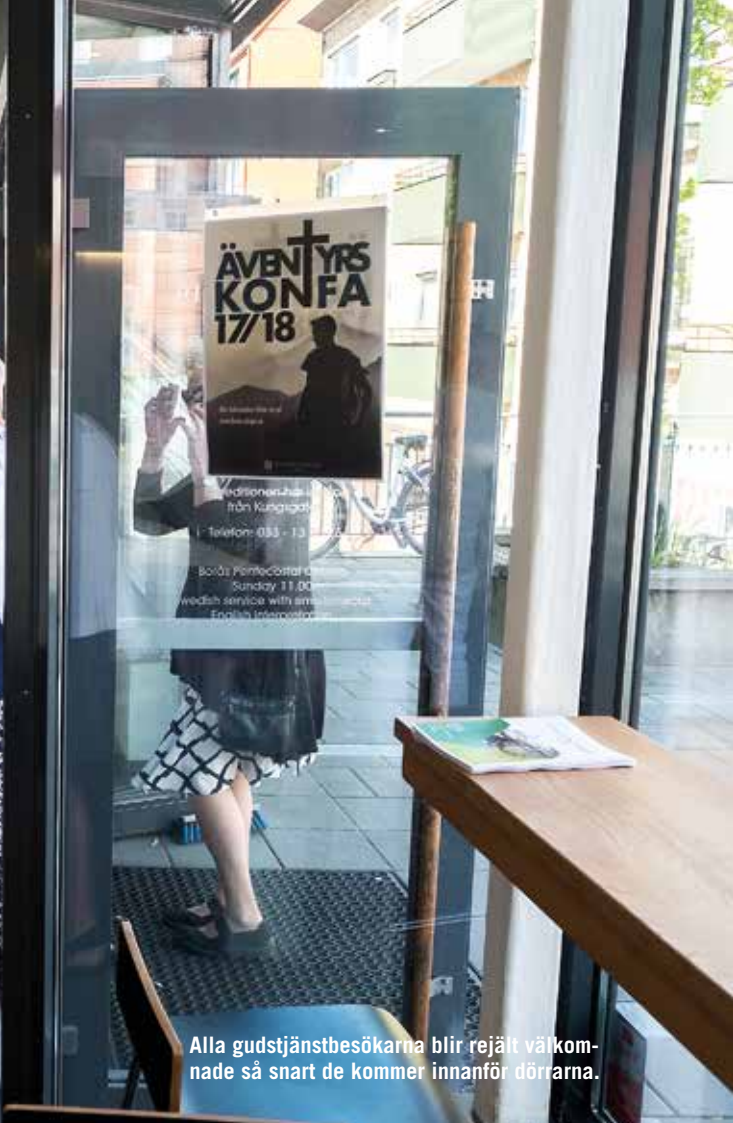
Alla gudstjänstbesökarna blir rejält välkomnade så snart de kommer innför dörrarna.