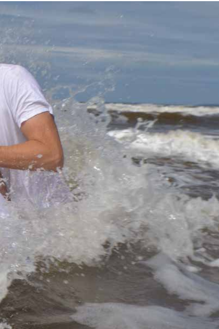
sjätte året i följd.